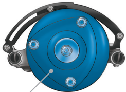
Top of MacPherson strut • Oberer Teil des Federbeins MacPherson • Parte superior del brazo de suspensión MacPherson • Zgornji del vzmetne noge MacPherson